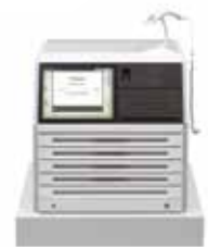
Table Top Cabinet